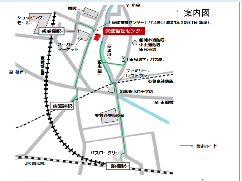
保健福祉センターへの迂回路の案内図(車両用拡大図)